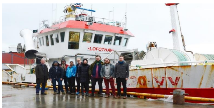
Verdensteatret i Stamsund under SIT 2016. Gjestespillet «Broen over gjørme» var et samarbeid mellom SIT og Figurteatret.

Figurteatret arrangerte 2 gjestespill: Broen over gjørme av Verdensteatret (Oslo), i samarbeid med SIT 2017; og New Classical Kids on the Block av MIN Ensemblet (Narvik), i samarbeid med Musikk i Nordland.