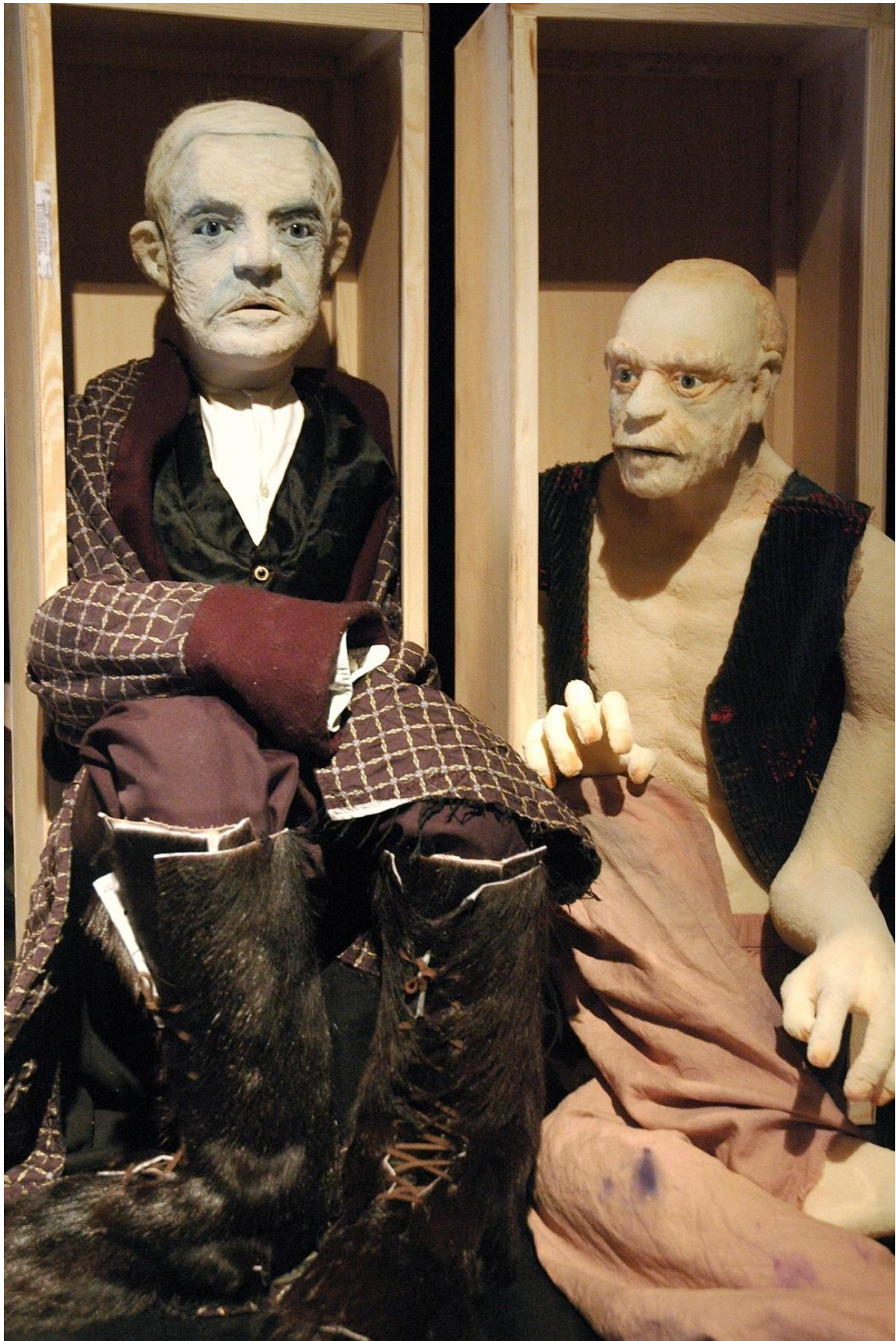
The Painter-dukker (prøve).